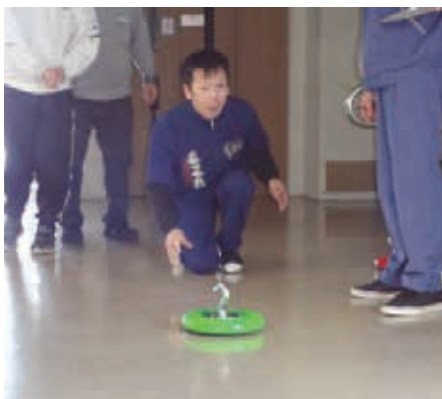
ゲーム大会の写真です